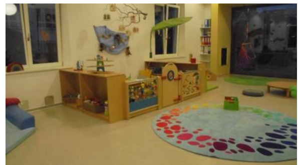
Sinnes- und Kreativraum

Die Räume sind hell und freundlich eingerichtet. Zudem sind die beiden Funktionsräume individuell mit verschiedenen Spielmöglichkeiten ausgestattet. Die Spielbereiche sind auf die aktuellen Bedürfnisse der Kinder ausgerichtet und werden regelmäßig gemeinsam mit den Kindern, je nach Interesse und Entwicklungsstand, ausgelegt und verändert.