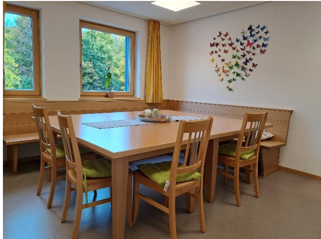
Personalraum Kindergarten an der Vils

"Das Leben anzuregen - und es dann frei entwickeln zu lassen - hierin liegt die erste Aufgabe des Erziehers." (Maria Montessori)